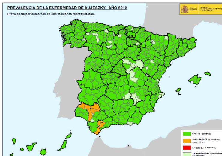
Figura 4: Situación actual de la seroprevalencia de la EA en porcino doméstico en España