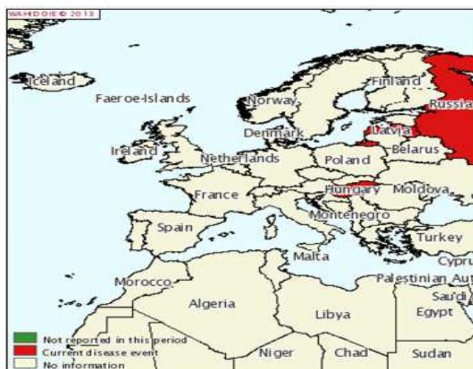
Figura 1. Situación de la PPC en Europa durante el primer semestre 2013

Durante el primer semestre del 2013 ha habido, en el continente europeo eventos abiertos en Letonia, Hungría y Rusia como puede comprobarse en el siguiente mapa: