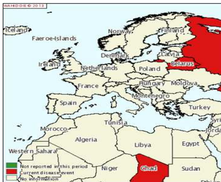
Figura 3: Situación de la PPA en Europa durante el primer semestre del 2013 (Fuente: WAHID Interface OIE 2013)

Durante el primer semestre del 2013 ha habido, en el continente europeo eventos abiertos en Rusia y Bielorrusia (Fuente: WAHID Interface OIE 2013), como puede comprobarse en el siguiente mapa: